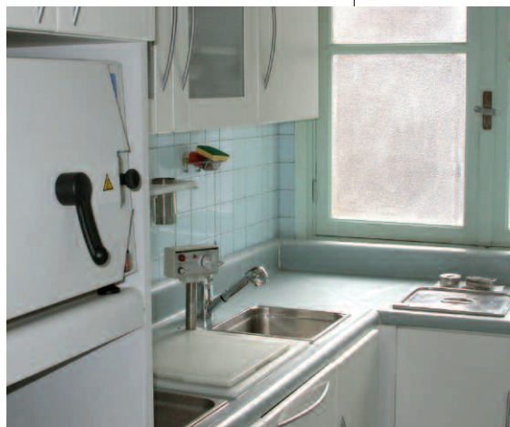
L'espace de stérilisation.

Cathy : « Au fil des années, j'ai pu apprécier une meilleure organisation au niveau de la gestion de l'agenda et des ententes financières, dans un cadre plus agréable avec la nouvelle décoration du cabinet. »